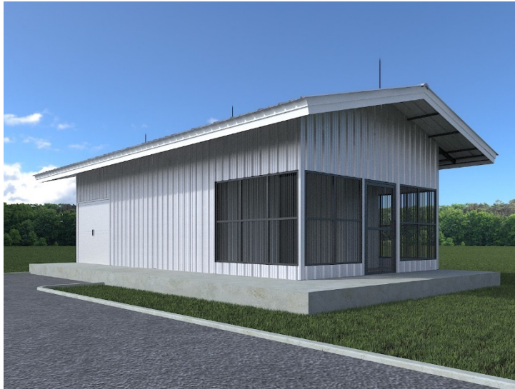
Ilustrasi bangunan Pabrik Es Portabel kapasitas 1 ton/siklus