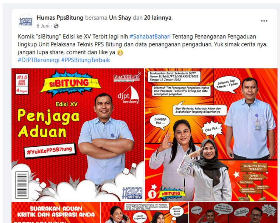
Pengaduan Melalui Media Elektronik: Facebook Humas_PPS Bitung