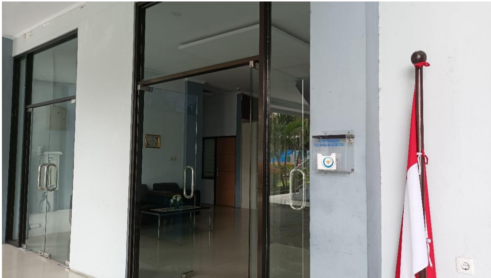
Lokasi Kotak Pengaduan : Kantor Utama PPS Bitung