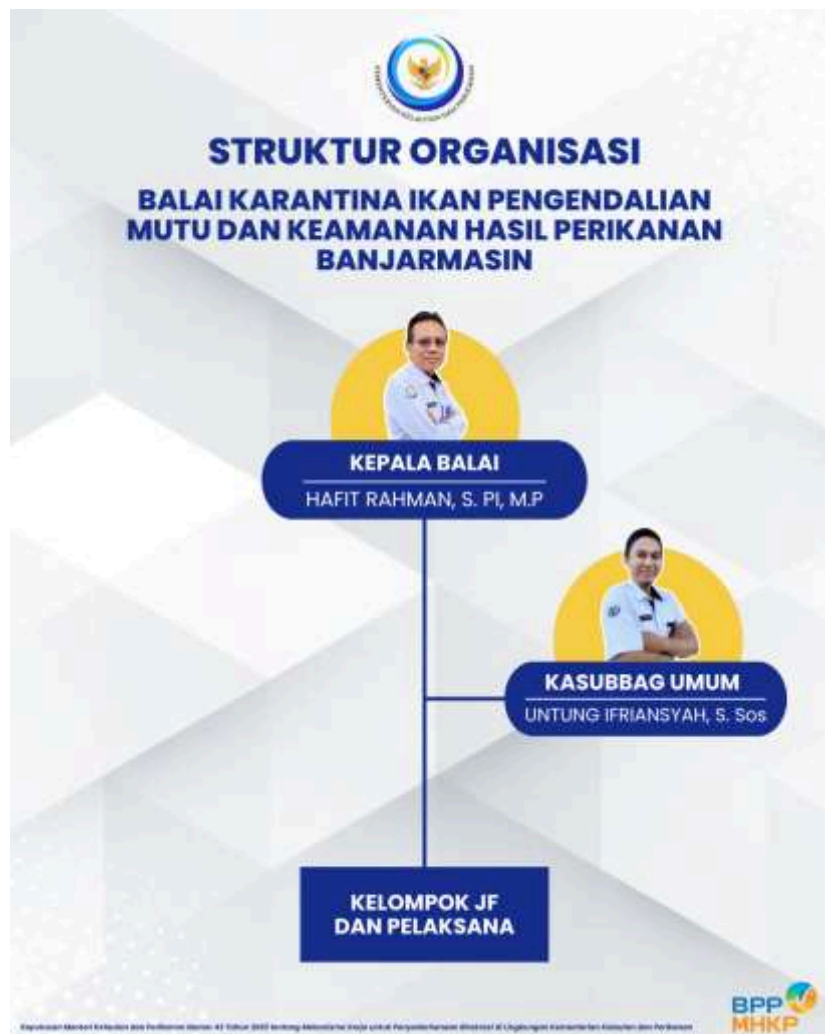
Gambar 1. Struktur Organisasi Balai KIPM Banjarmasin

Sesuai dengan Peraturan Menteri Kelautan dan Perikanan Nomor 92/PERMEN-KP/2020 tentang Organisasi dan Tata Kerja Unit Pelaksana Teknis Karantina Ikan, Pengendalian Mutu, dan Keamanan Hasil Perikanan, Balai KIPM Banjarmasin mempunyai struktur organisasi sebagai berikut :