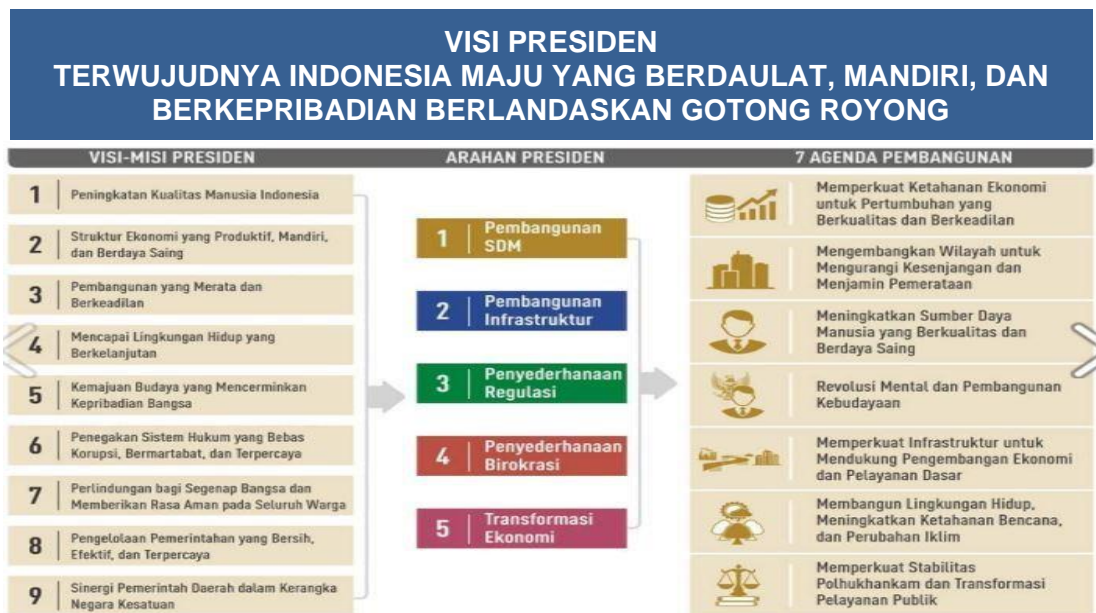
Gambar 1 Visi, Misi dan Arah Presiden 2020-2024

Visi Presiden 2020-2024 disusun berdasarkan arahan RPJPN 2020-2025 yaitu “Terwujudnya Indonesia Maju yang Berdaulat, Mandiri, dan Berkepribadian Berlandaskan Gotong Royong”. Visi tersebut diwujudkan dalam 9 (Sembilan) Misi yang dikenal sebagai Nawacita Kedua yaitu : (1) Peningkatan Kualitas Manusia Indonesia, (2) Struktur Ekonomi yang Produktif, Mandiri, dan Berdaya Saing, (3) Pembangunan yang Merata dan Berkeadilan, (4) Mencapai Lingkungan Hidup yang Berkelanjutan, (5) Kemajuan Budaya yang Mencerminkan kepribadian Bangsa, (6) Penegakan Sistem Hukum yang Bebas Korupsi, Bermartabat dan Terpercaya, (7) Perlindungan bagi Segenap Bangsa dan Memberikan Rasa Aman pada Seluruh Bangsa, (8) Pengelolaan Pemerintahan yang Bersih, Efektif, dan Terpercaya, dan (9) Sinergi Pemerintah Daerah dalam Kerangka Negara kesatuan.