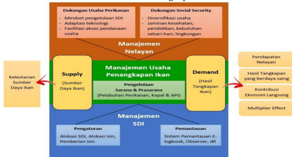
Gambar 3. Implementasi Pendekatan Supply-Demand terhadap Manajemen Perikanan Tangkap

antara stakeholder nelayan, pengusaha, dengan pemerintah ( Gambar 3 ). Penggunaan pendekatan supply-demand juga dilakukan dalam rangka mewujudkan arah kebijakan utama industrialisasi sektor kelautan dan perikanan yang telah dicanangkan oleh Menteri Kelautan dan Perikanan.