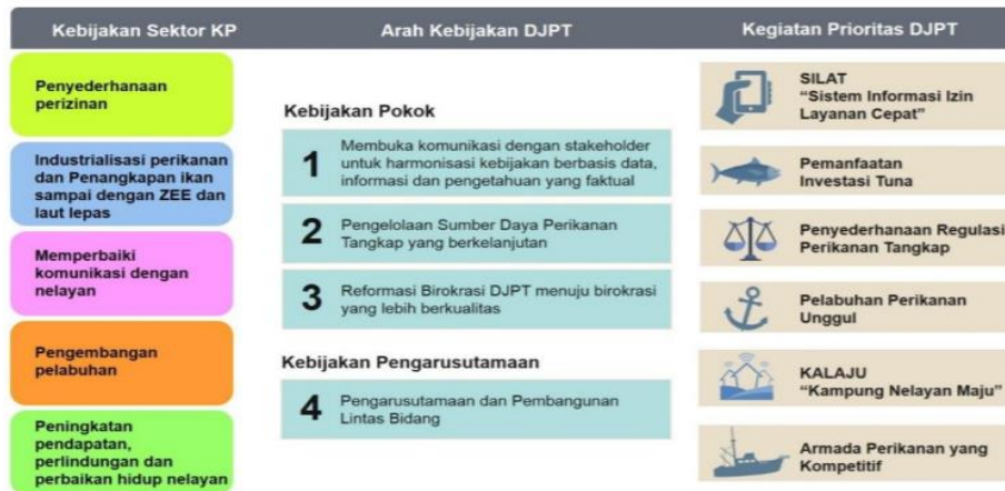
Gambar 4. Pendekatan Perencanaan Strategis Sub Sektor Perikanan Tangkap, Arah Kebijakan Utama, Serta Kegiatan Prioritas Tahun 2020-2024