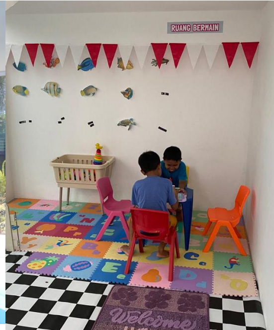
Tempat bermain anak