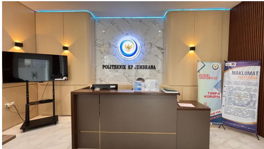
Gambar 3. Meja Layanan Permohonan Informasi Publik PKPJ