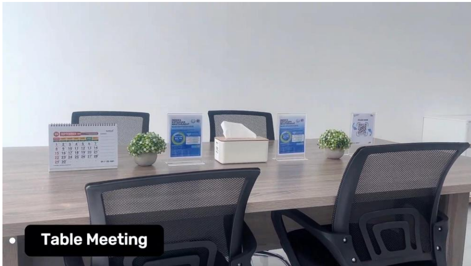
Gambar 4. Meja Rapat atau Diskusi