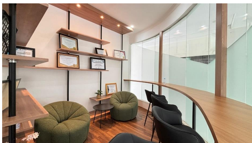
Gambar 2. Ruang Tunggu Pelayanan Informasi Publik PKPJ