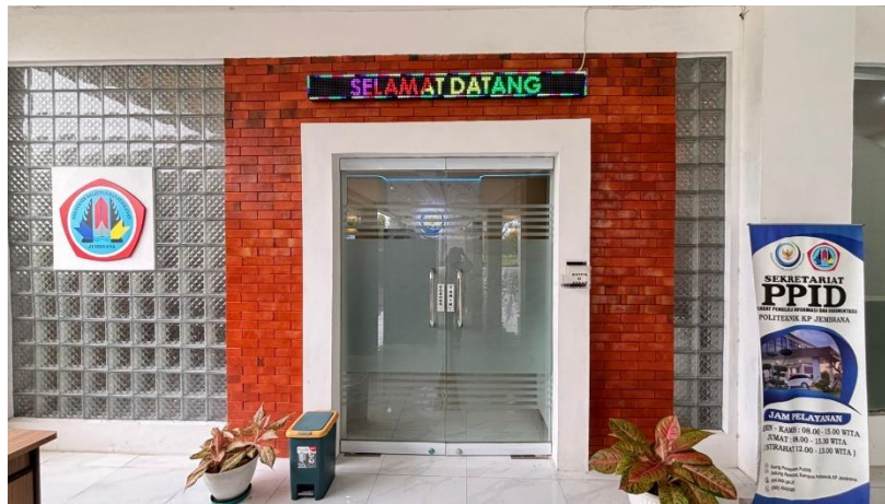
Gambar 1. Tampak Depan Ruang Pelayanan Informasi Publik PKPJ

Selain itu, ruang pelayanan permohonan informasi publik juga berfungsi sebagai tempat untuk mengajukan permohonan informasi atau berkomunikasi bagi masyarakat yang membutuhkan informasi.