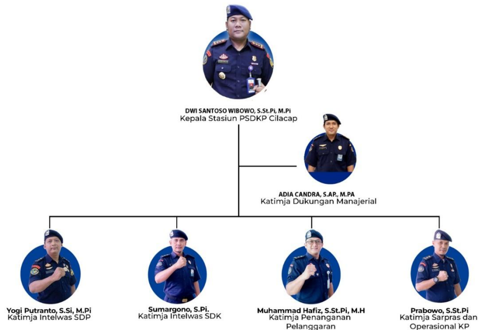
Gambar 1. Struktur Organisasi Stasiun PSDKP Cilacap

organisasi Stasiun PSDKP Cilacap tercantum dalam Gambar 1 sebagai berikut: