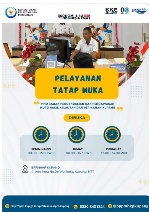
Gambar 3. Jam Layanan