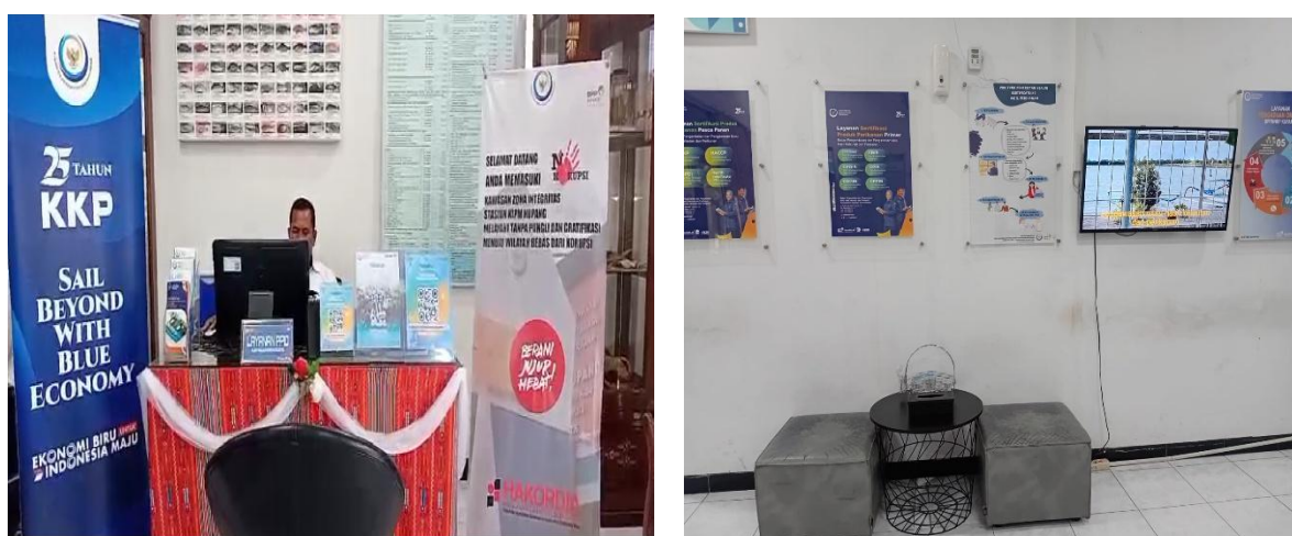
Gambar 4. Ruang Pelayanan PPID