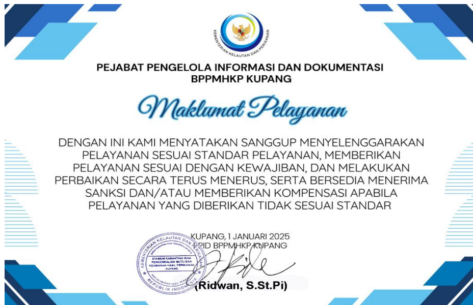
Gambar 2. Maklumat Pelayanan