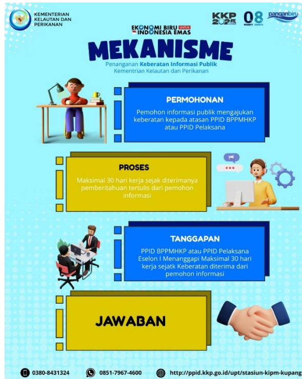
Gambar 6. Mekanisme Penanganan Keberatan Informasi Publik