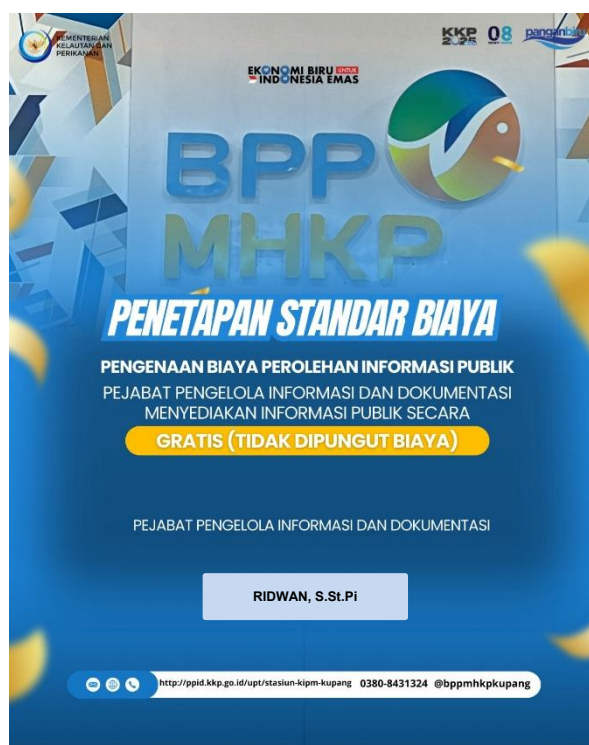
Gambar 7. Penetapan Standar Biaya