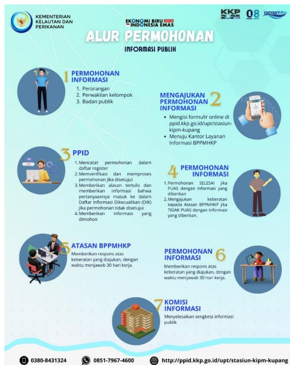
Gambar 5. Tata cara Permohonan Informasi

https://ppid.kkp.go.id/upt/stasiun-kipm-kupang/ ; Counter Layanan Meja Informasi dan melalui kanal medsos (Instagram, Facebook, Twitter dan Whatsapp Business). Mekanismenya sebagai berikut: