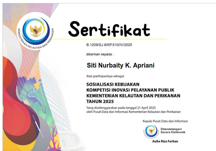
Gambar 8. Sertifikat Pelatihan

Pelayanan Publik yang prima merupakan salah satu kunci dalam menciptakan hubungan yang baik antara pemerintah dan masyarakat. Hal ini khususnya penting dalam konteks layanan informasi publik di lingkungan Kementerian Kelautan dan Perikanan, Dimana transparansi dan keterbukaan informasi menjadi landasan utama dalam menjalankan tugas dan fungsi organisasi. Untuk itu, peningkatan kapasitas sumber daya manusia yang berfokus pada pelayanan publik berkualitas menjadi sebuah kebutuhan yang mendesak. Kegiatan pelatihan budaya prima dilakukan dalam rangka meningkatkan kapasitas SDM yang terlibat dalam pelayanan informasi publik di BPPMHKP Kupang. Pelatihan ini bertujuan untuk memberikan pemahaman yang mendalam tentang pentingnya pelayanan prima, serta memberikan keterampilan dan pengetahuan yang diperlukan agar setiap interaksi dengan masyarakat dapat berlangsung dengan baik.