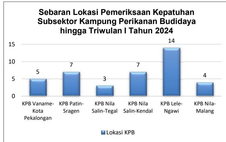
Gambar 5. Sebaran lokasi pemeriksaan kepatuhan subsektor kampung budidaya ikan Triwulan I Taun 2024 lingkup Stasiun PSDKP Cilacap

Sebaran lokasi pemeriksaan kepatuhan subsektor kampung perikanan budidaya di lingkup Stasiun PSDKP Cilacap sampai dengan Triwulan I Tahun 2024 dapat di lihat pada gambar berikut: