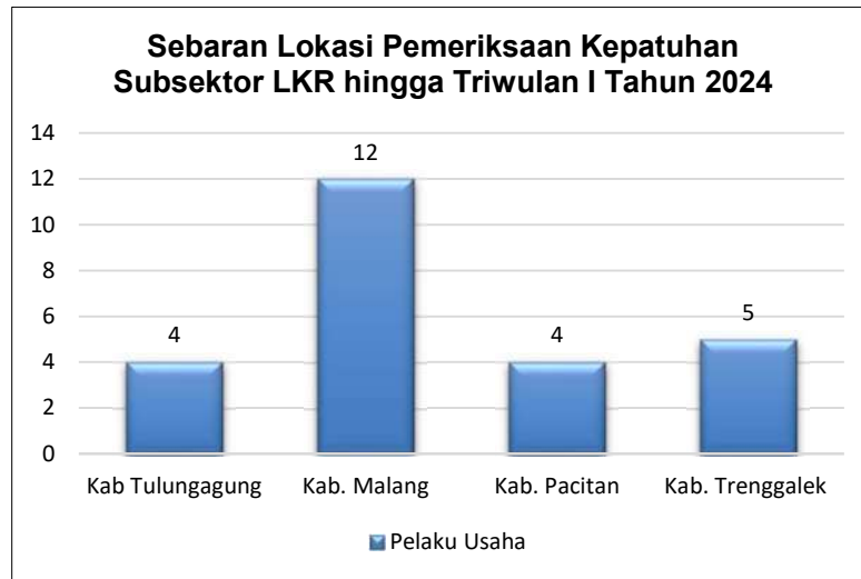
Gambar 6. Sebaran lokasi pemeriksaan kepatuhan subsektor LKR Triwulan I Taun 2024 lingkup Stasiun PSDKP Cilacap

Pada tahun Triwulan I Tahun 2024 capaian pengawasan lainnya LKR di lingkup Stasiun PSDKP Cilacap adalah sebanyak 25 Objek Pengawasan. Kegiatan pengawasan tersebut didominasi oleh pengawasan kepada pelaku usaha di Kab. Malang.