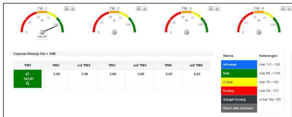
Gambar 2. Capaian Sasaran Kegiatan Stasiun PSDKP Cilacap Triwulan I Tahun 2024

Sebagaimana telah diuraikan pada Bab sebelumnya, pada Tahun 2024 Stasiun PSDKP Cilacap telah menyempurnakan dan menetapkan 8 Sasaran Kegiatan dengan 24 IKU. Nilai Kinerja (NKO) Stasiun PSDKP Cilacap pada Triwulan I Tahun 2024 adalah sebesar 103,87% dari total 11 IKU yang dilakukan pengukuran capaian, dengan kategori biru (istimewa) sebanyak 4 IKU dan kategori hijau (baik) sebanyak 9 IKU sebagaimana terlihat pada gambar dibawah.