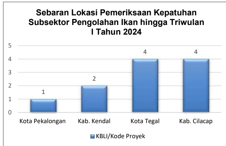
Gambar 4. Sebaran lokasi pemeriksaan kepatuhan subsektor pengolahan ikan Triwulan I tahun 2024 lingkup Stasiun PSDKP Cilacap

Sebaran lokasi pemeriksaan kepatuhan subsektor pengolahan ikan di lingkup Stasiun PSDKP Cilacap sampai dengan Triwulan I Tahun 2024 dapat di lihat pada gambar berikut: