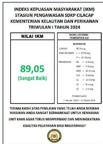
Gambar 7. Indeks Kepuasan Masyarakat Pengguna Layanan SLO lingkup Stasiun PSDKP Cilacap

Metode yang digunakan dalam pengumpulan data tersebut adalah pelaksanaan survey terhadap 85 orang responden pengguna layanan di Stasiun PSDKP Cilacap pada periode Triwulan I tahun 2024, dengan latar pendidikan dari SD sampai dengan S2. Pelaksanaan survey dilakukan melalui website Si Susun KKP pada tautan https://ptsp.kkp.go.id/skm/ .