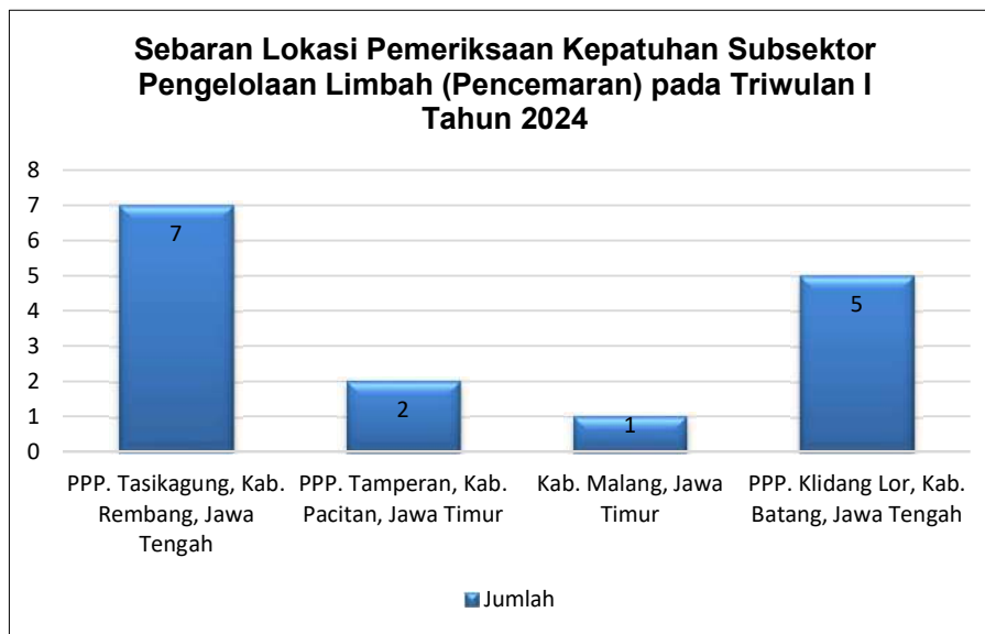
Gambar 3. Sebaran Lokasi Pelaku Usaha Perikanan dan Non Perikanan yang di Periksa Kepatuhan dalam Pengelolaan Limbah

Capaian pengawasan unit usaha perikanan dan non perikanan yang diperiksa kepatuhannya dalam pengelolaan limbah yang berdampak pada sumber daya ikan dan lingkungannya pada Triwulan I tahun 2024 yaitu 15 pelaku usaha, dari jumlah target sebanyak 40 pelaku usaha. Sebaran lokasi pelaku usaha perikanan dan non perikanan yang diperiksa kepatuhannya dalam pengelolaan limbah yang berdampak pada sumber daya ikan dan lingkungannya sebagaimana gambar dibawah ini: