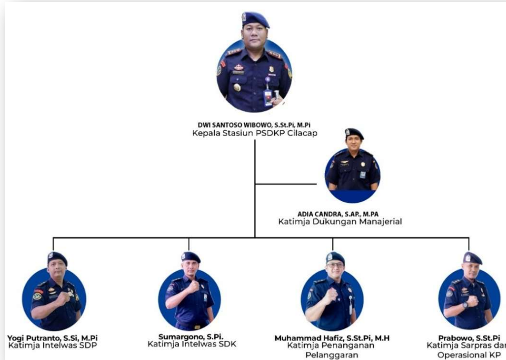
Gambar 1. Struktur Organisasi Stasiun PSDKP Cilacap

Selanjutnya dalam melaksanakan tugas dan fungsi organisasi yang telah ditetapkan, perlu dilakukan pembagian tugas dan kewenangan. Struktur organisasi Stasiun PSDKP Cilacap tercantum dalam Gambar 1 sebagai berikut: