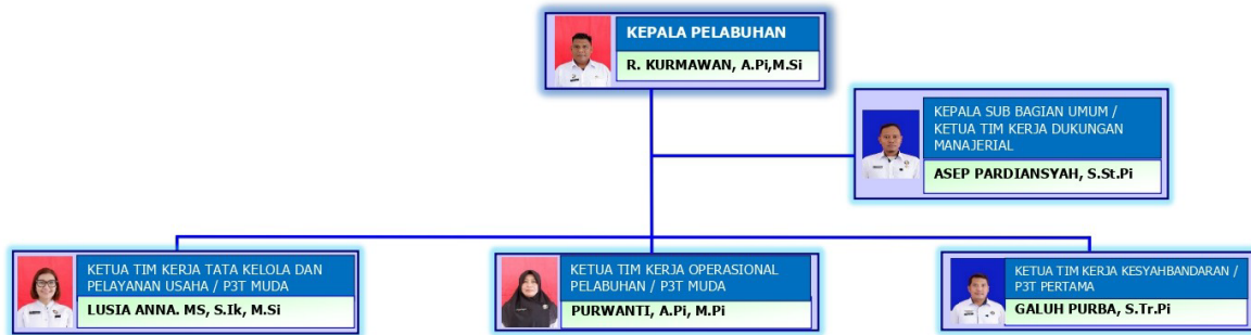
Gambar 2. Struktur Organisasi PPN Sungailiat Tahun 2025