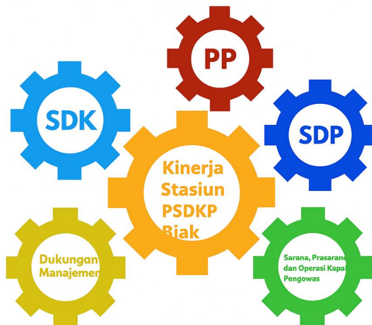
Gambar 3. Kinerja Stasiun PSDKP Biak

Nilai capaian tersebut dihitung secara berkala (triwulanan dan tahunan) dengan membandingkan realisasi capaian dengan target yang telah ditetapkan. Hasil pengukuran kinerja dimasukkan ke dalam sistem aplikasi Kinerjaku berbasis teknologi informasi melalui http://kinerjaku.kkp.go.id , dan kemudian dituangkan dalam LKj yang dilengkapi dengan analisis dan pembahasannya.