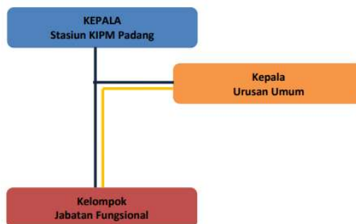
Gambar 1. Struktur Organisasi SKIPM Pangkalpinang

Struktur ini memastikan penyelenggaraan layanan publik yang profesional, responsif, dan akuntabel sesuai dengan standar kementerian guna menjamin mutu hasil perikanan di wilayah Provinsi Kepulauan Bangka Belitung.