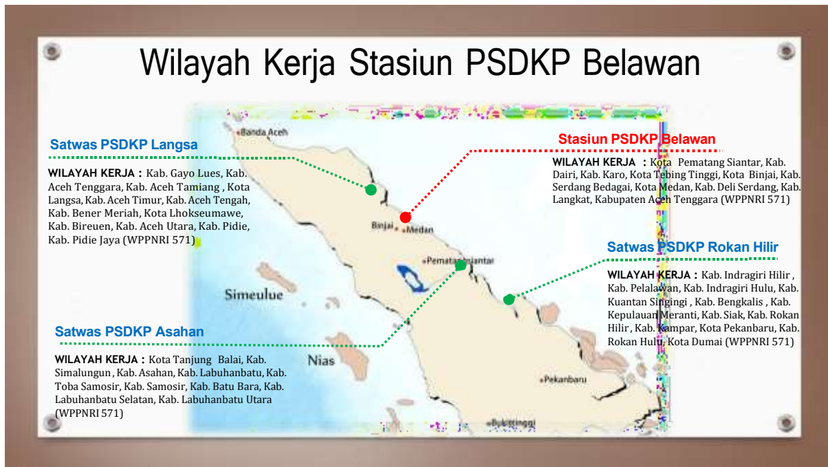
Gambar 2. Wilayah Kerja Stasiun Pengawasan SDKP Belawan

Dalam pelaksanaan operasional pengawasan di wilayah kerja, Stasiun Pengawasan SDKP Belawan membawahi 3 Satuan Pengawasan SDKP, yaitu: