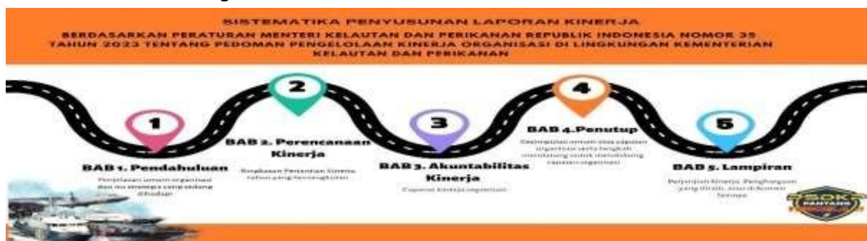
Gambar 3. Sistematika Penyusunan Lkj Stasiun PSDKP Belawan

Secara garis besar sistematika penyajian Laporan Kinerja Stasiun PSDKP Belawan Tahun 2025 diuraikan sebagai berikut :