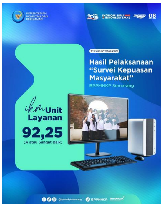
Gambar 3.2 Indek Kepuasan Masyarakat Tahun 2025