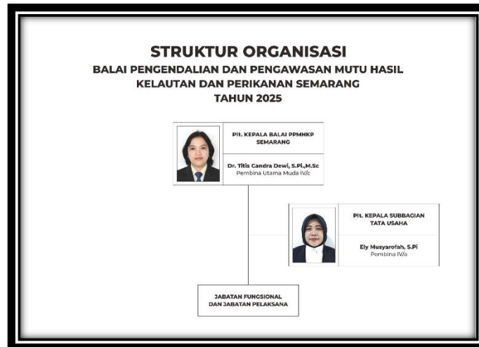
Gambar 1.1 Struktur Organisasi Balai PPMHKP Semarang

Mutu, Pranata Komputer, Arsiparis, Analis Pengelola keuangan APBN, pranata keuangan APBN, penata laksana barang, Analis SDM aparatur, Pranata SDM Aparatur dan Jabatan Fungsional Umum lainnya, dengan jumlah SDM aparatur yang mendukung Balai Karantina Ikan Pengendalian Mutu dan Keamanan Hasil Perikanan Semarang saat ini berjumlah 44 orang pegawai, yang terdiri dari 35 orang PNS dan 8 orang P3K dan 1 P3K Paruh Waktu.