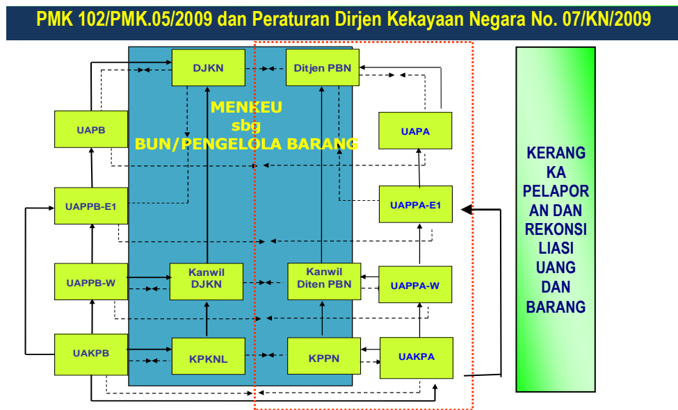
Gambar 2 Diagram Rekonsiliasi Internal dan Eksternal LBMN

Mekanisme rekonsiliasi sebagaimana tergambar di atas telah berjalan meskipun belum sempurna. Rekonsiliasi saat ini masih terbatas pada proses pemutakhiran ( updating ) data BMN antara pengelola dengan pengguna barang dilakukan secara semesteran dan tahunan. Pada CaLBMN Semester I Tahun Anggaran 2025 ini, nilai BMN yang disajikan telah diupayakan untuk dilakukan rekonsiliasi dengan nilai BMN yang akan disajikan dalam LBPP-E1 BPPSDM Kelautan dan Perikanan dan LBMNT LBP KKP Per 31 Juni 2025. Untuk selanjutnya, pada tingkat UAPB, dilakukan rekonsiliasi BMN dengan Direktorat Jenderal Kekayaan Negara Kementerian Keuangan serta rekonsiliasi dengan Laporan keuangan untuk penyusunan LKPP.