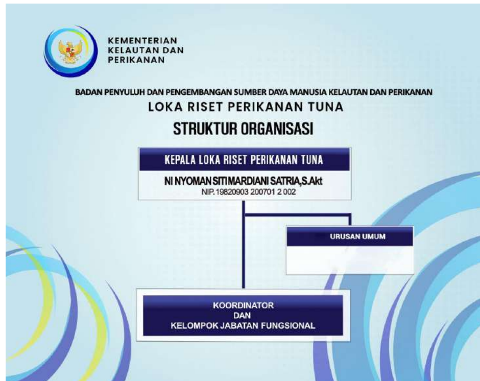
Struktur Organisasi Loka Riset Perikanan Tuna

Adapun struktur organisasi dan pejabat struktural yang duduk dalam organisasi Loka Riset Perikanan Tuna terlihat pada Bagan Struktur Organisasi Loka Riset Perikanan Tuna sebagai berikut: